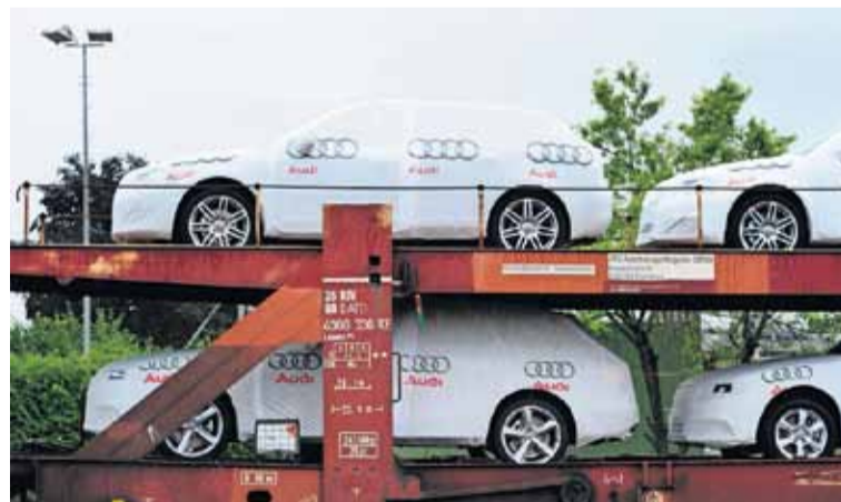
Neuwagen: Wenige Hersteller stehen 10 000 Garagisten gegenüber.

Im Automarkt stehen wenige marktmächtige Hersteller etwa 10 000 Garagisten gegenüber. Die KFZ-Bekanntmachung garantiert den kleinen Auto-